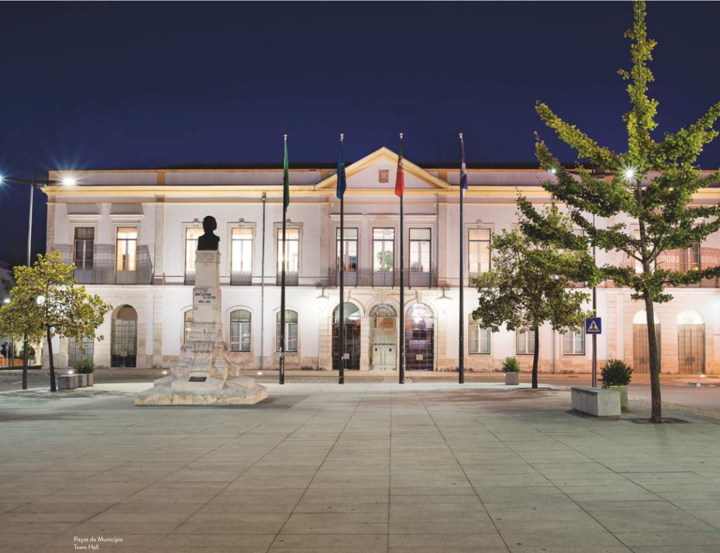
Paços do Município Town Hall