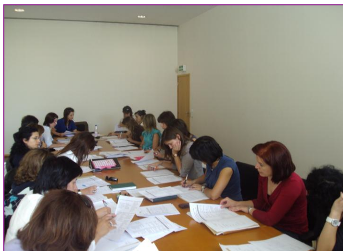
Ilustração 3 Reunião de Técnicas - Análise das Problemáticas Sociais, 2011