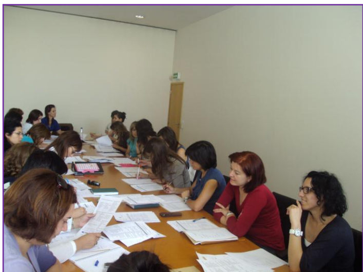
Ilustração 2 Reunião de Técnicas no âmbito da elaboração do Diagnóstico Social, 2011

O Diagnóstico social de Anadia no que concerne aos problemas identificados teve como base as áreas de intervenção do Plano Nacional de Acção para a Inclusão (2008-2010), bem como outras tidas como pertinentes para o concelho, consideradas pelos parceiros do Conselho Local para a Acção Social de Anadia.